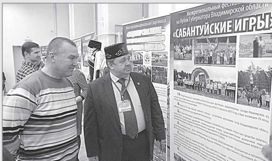
Выставка нац. проектов в областной библиотеке.