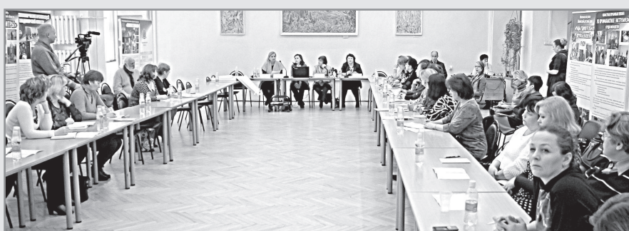
На семинаре в областной библиотеке.

Представители светской науки убеждены, что государство обязано учитывать интересы атеистов и представителей незапрещённых религиозных направлений – в том плане, что представители разных мировоззренческих взглядов, являясь гражданами России, должны иметь равные возможности на реализацию права на свободу совести и вероисповедания.